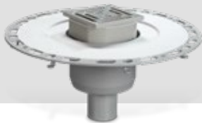
Bodenablauf senkrecht, DN 40 / DN 50 Art.-Nr. 1371