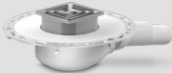
Bodenablauf waagrecht, DN 40 / DN 50 Art.-Nr. 1370